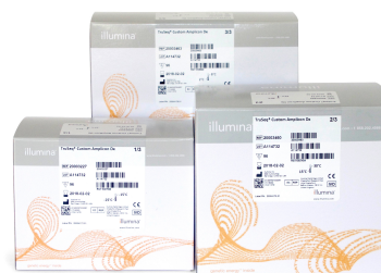
Figura 1: TruSeq Custom Amplicon Kit Dx: TruSeq Custom Amplicon Kit Dx, regolamentato dall'FDA e marcato CE-IVD, fornisce i reagenti per la preparazione delle librerie che consentono ai laboratori di sviluppare i propri test diagnostici da utilizzare sugli strumenti di sequenziamento Dx Illumina.