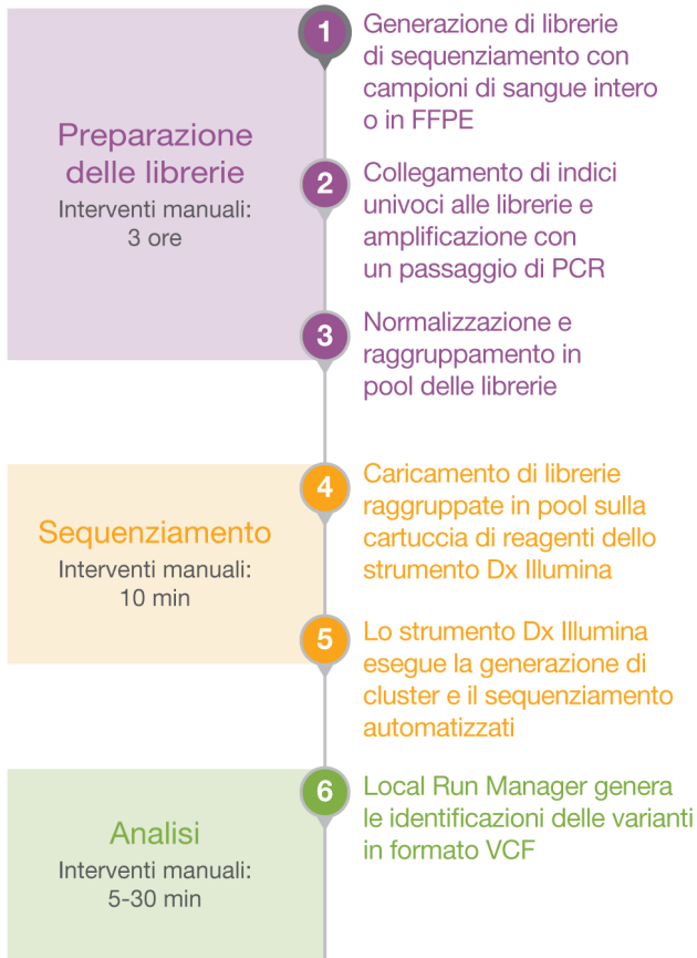
Figura 2: Flusso di lavoro ottimizzato per il saggio personalizzato: il flusso di lavoro di TruSeq Custom Amplicon Kit Dx fornisce i dati dal DNA grazie a una procedura ottimizzata in sei fasi.

TruSeq Custom Amplicon Kit Dx produce librerie pronte per il sequenziamento che possono essere caricate su uno strumento di sequenziamento Dx Illumina per la generazione di dati di sequenziamento affidabili in meno di due giorni.